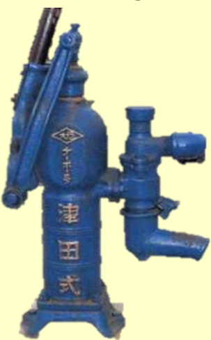
昭和9年2月9日 出願図